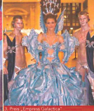
3. Preis „Empress Galactica“ von Matthias Maus