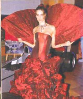
2. Preis „bouquet en rouge“ von Jola Biro