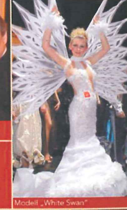
Modell „White Swan“