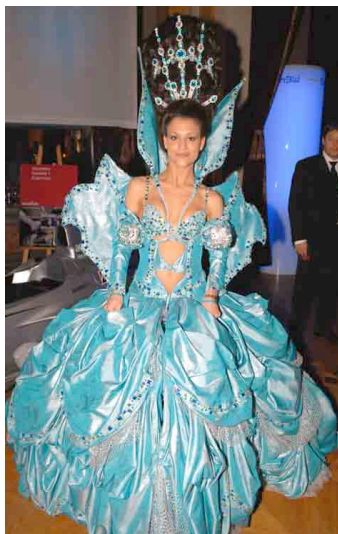
Modellname: Empress Galactica