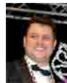
Designer: Matthias Maus