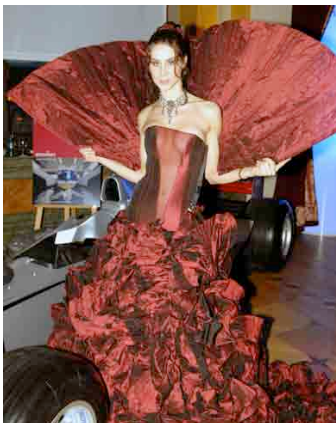
Modellname: bouquet en rouge