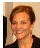
Designerin: Jola Biro